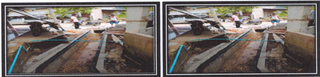
โครงการก่อสร้างคูระบายน้ำซอยหลังมัสยิดบ้านไร่