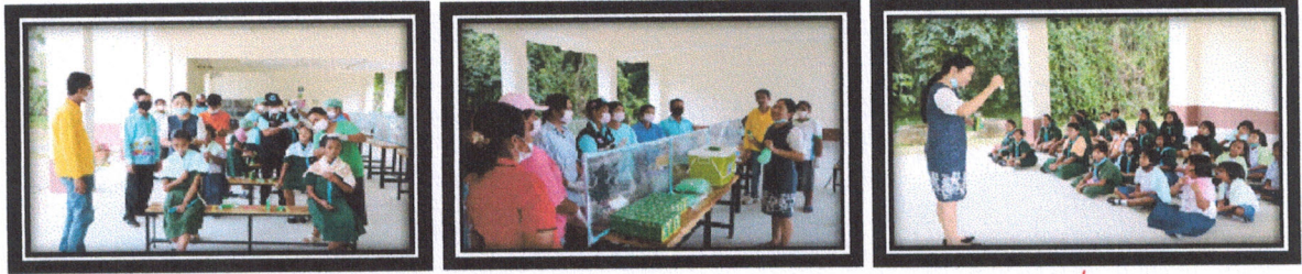
โครงการห่างไกลจากเหาเด็กนักเรียนในศูนย์พัฒนาเด็กเล็กและสถานศึกษาตำบลกระปี่น้อย

๑๔. โครงการรณรงค์ป้องกันและควบคุมโรคไข้เลือดออก เทศบาลตำบลกระปี่น้อย งบประมาณ ๘๘,๓๐๐ บาท (งบ สปสช.)