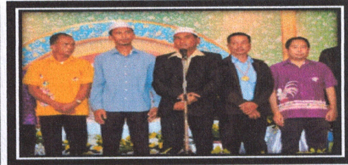
โครงการจัดงานประเพณีเมาลีลิดกลางและแข่งทักษะทางวิชาการตำบลกระป๋องน้อย