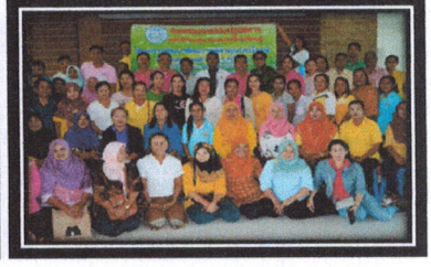
โครงการพัฒนาศักยภาพผู้ทำคุณประโยชน์แก่เทศบาลตำบลกระปี่น้อย

นอกจากนี้เทศบาลตำบลกระปี่น้อยได้มีการสร้างภาคีเครือข่ายกับภาครัฐ ส่วนราชการในพื้นที่ภาคเอกชน ทั้งในและนอกพื้นที่ตำบลกระปี่น้อย เพื่อส่งเสริม สนับสนุนการดำเนินงานและกิจกรรมต่างๆ ของเทศบาลตำบลกระปี่น้อย และสนับสนุนให้มีการสร้างเครือข่ายต่างๆ ในชุมชนเพื่อสร้างความเข้มแข็ง และสร้างกระบวนการการมีส่วนร่วมในการพัฒนาชุมชนแบบยั่งยืน