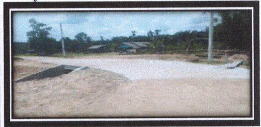
โครงการก่อสร้างท่อลอดเหลี่ยม คสล.ซอยโคกกอก