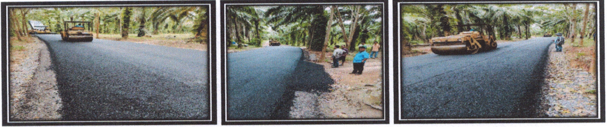
โครงการก่อสร้างถนนลาดยางสายนอก-ไฮโปะ หมู่ที่ 6