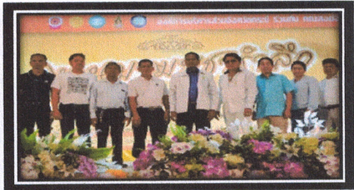
โครงการวันมาฆบูชารำลึก