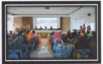
โครงการถนนปลอดถังขยะ