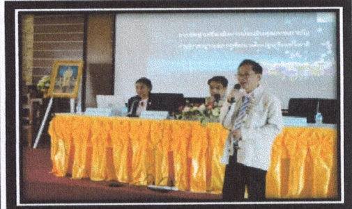
โครงการประกันคุณภาพภายในสถานศึกษาโดยหน่วยงานต้นสังกัด